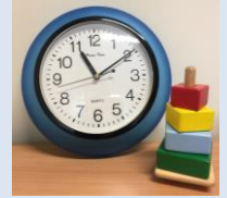
wissenschaftliche Karriere – Kinder – Vertragsbefristung

Wissenschaftliche Beschäftigte, die ein Vertragsverhältnis an der TU Berlin nach § 2 Abs. 1 S.1, 2 WissZeitVG (häufig betrifft dies WiMis auf haushaltsfinanzierten Stellen) haben, können ab sofort ein transparentes und für alle Fakultäten einheitliches Verfahren zur möglichen Beantragung der sog. familienpolitischen Komponente nutzen. Das Wissenschaftszeitvertragsgesetz sieht unter bestimmten Bedingungen eine Verlängerungsoption für wissenschaftliche Beschäftigte mit Kind(ern) vor: Dabei verlängert sich nach § 2 Abs. 1 S. 4 WissZeitVG die insgesamt zulässige Befristungsdauer von zwölf Jahren (jeweils sechs Jahre vor bzw. nach der Promotion) bei Betreuung eines oder mehrerer Kinder unter 18 Jahren um zwei Jahre je Kind, um Nachteile bei der Erreichung des Qualifizierungszieles ausgleichen zu können. Mehr Infos: Rundschreiben und Antrag